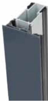
Gris / Plata