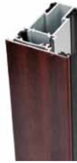
Caoba / Plata