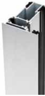
Plata / Plata