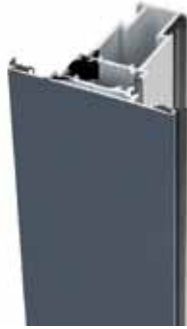
Sección con fijos Gris / Plata