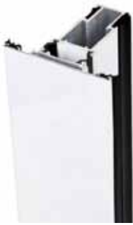
Sección con fijos Blanco / Blanco