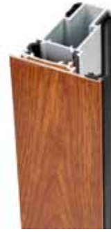
Roble / Plata