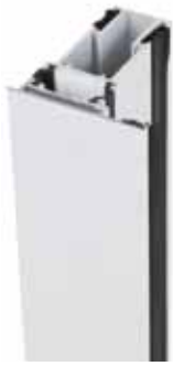
Blanco / Blanco